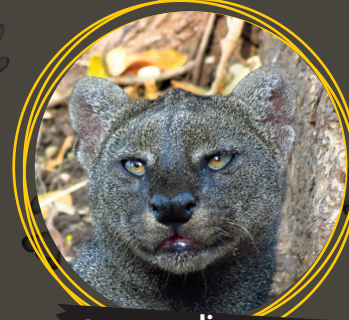
Yaguarundi ( Herpailurus yagouaroundi )