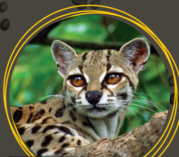
Caucel ( Leopardus wiedii )