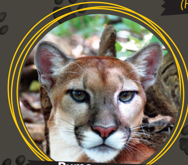
Puma ( Puma concolor )