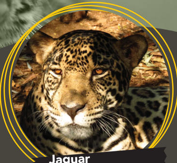
Jaguar ( Panthera onca )