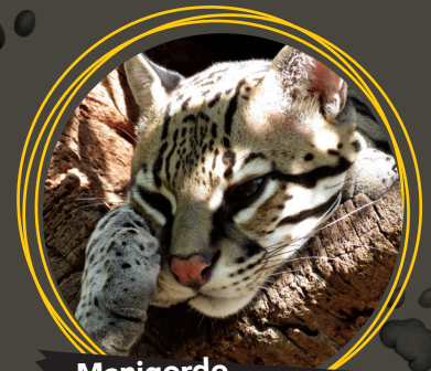
Manigordo ( Leopardus pardalis )